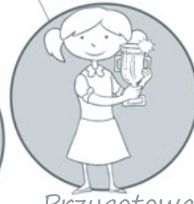
Przygotowanie do konkursów