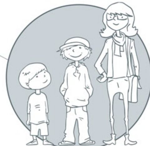
Uczniowie od szkoły podstawowej do szkoły średniej